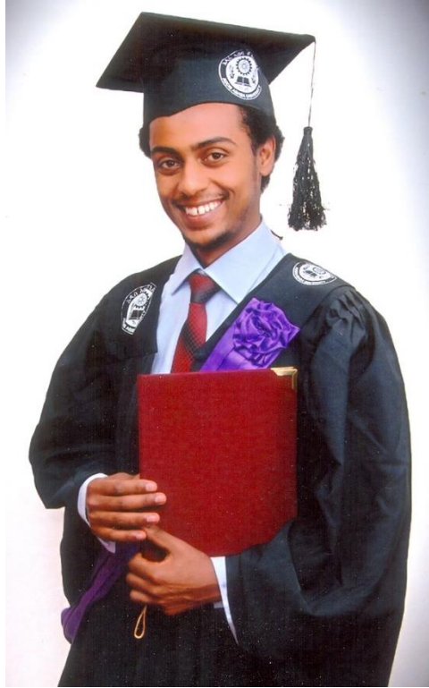
ባንታየሁ ደምሌ የህግ ተመራቂ